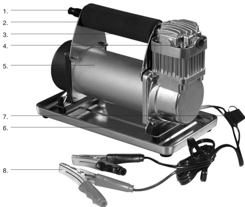
Рис.2 Компрессор R20